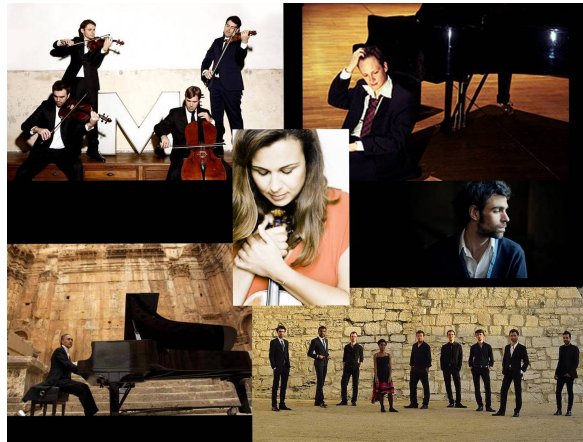
15 e édition du festival

Le festival 2017 des Musicales de Blanchardeau sera éclairé du miroitement des œuvres musicales, tantôt chatoyantes, méditatives ou sombres toujours issues du grand répertoire du 17 e au 20 e siècle, portées par des artistes de grand talent qui en seront les interprètes. Les œuvres de Debussy et de Ravel y brilleront tout particulièrement.